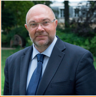
Stéphane Travert, ministre de l'Agriculture et de l'Alimentation.

L'arbre est une composante majeure des paysages et de la biodiversité. Il permet de lutter contre l'érosion, de limiter le ruissellement de l'eau, d'enrichir le sol, etc. Il contribue ainsi à atténuer les effets du changement climatique. L'agroforesterie, c'est-à-dire la mise en place de systèmes de production associant arbre et agriculture utilise ces bienfaits de l'arbre pour les mettre au service de l'agriculture. C'est également un des leviers pour répondre aux objectifs de l'initiative 4 pour 1000 « les sols pour la sécurité alimentaire et le climat » lancée à l'occasion de la COP21.