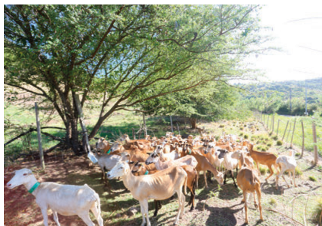
Chèvres de Martinique.

Le Parc naturel régional de Martinique poursuit l'accompagnement de la filière ovine et notamment la valorisation de la viande d'agneau qui bénéficie de la marque en développant plusieurs volets dont la mise en place de projet de valorisation des haies naturelles chez les éleveurs bénéficiant de cette marque.