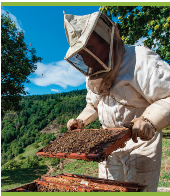
Apiculteur dans les Cévennes.

Les parcs nationaux déploient aussi la marque Esprit parc national sur les produits de la ruche. Une large gamme de miels est ainsi proposée au niveau national et révèle la diversité des territoires, de leurs milieux naturels et des fleurs, arbustes et arbres qui les composent au fil des saisons. Le cahier des charges permet de marquer des miels produits dans un environnement naturel privilégié. La marque oriente son cahier des charges en priorité vers les méthodes de conduite des ruchers (entretien de l'emplacement et récolte sans produit chimique, matériaux de la ruche naturels...) et vers l'implication de l'apiculteur dans la vie du territoire. Dans l'offre proposée, on peut retrouver un certain nombre de miels de forêt, produits à la Réunion, en Guadeloupe, dans les Ecrins ou encore dans les Cévennes.