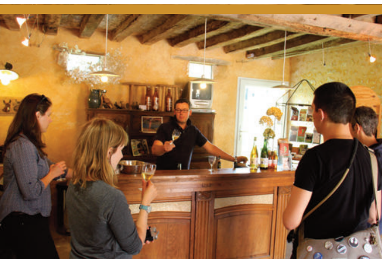
Comptoir du Parc naturel régional du Perche.

Il s'agit ici de faciliter l'interprétation des patrimoines identitaires du Perche, l'intérêt de les préserver et de mettre en valeur les actions menées en partenariat avec le Parc naturel régional du Perche. Marquer ces prestations permet de diversifier l'activité, contribue au maintien du bocage, mieux apprécié, mieux connu dans ses différentes fonctions. Cette démarche s'inscrit également dans un projet d'AOP et dans un projet plus global de filière touristique territoriale de 38 prestataires (restaurateurs, hébergeurs, éleveurs de chevaux...) qui travaillent en réseau et dont font partie les 3 producteurs cidricoles engagés.