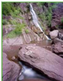
Gorges de Daluis et ses pélites rouges

Chez les Marbrées des pélites, le dernier chic est de se piquer de géologie et d'arborer un costume-coquille lie-de-vin assorti aux roches des gorges rouges où ils ont élu domicile.