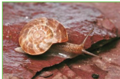
Marbrée des pélites