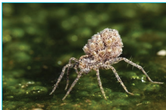
une cousine de Vesubia (Pardosa)

Les araignées-loup ont aussi l'étonnante habitude de transporter leurs « louveteaux » sur leur dos. Attention, sitôt quitté ce refuge, il faut décamper, l'instinct maternel a ses limites. Le caractère solitaire et la faim tenace pourrait bien se retourner contre les rejetons.