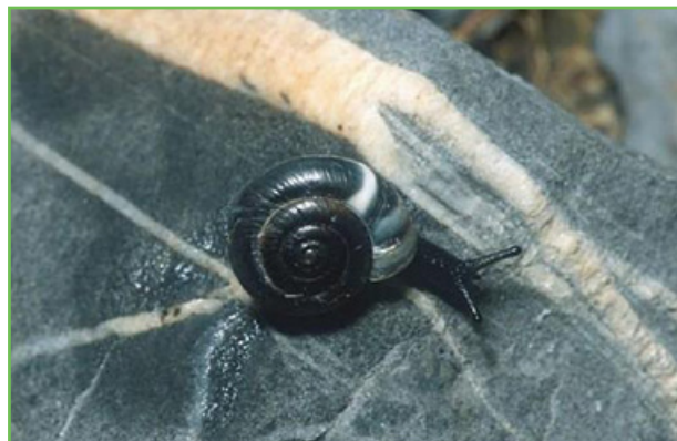
Fausse-veloutée du Mercantour

La Fausse-veloutée du Mercantour pousse le raffinement et la coquetterie à l'extrême, jusqu'à imiter les veines blanches sur fond de gris ardoise de la roche ! Admirez les élégantes rayures sur son maillot ! Il fut découvert par un illustre spécialiste des escargots du début du 20ème siècle. Comme il n'aime rien tant que se mettre en planque sous les pierres, il a ensuite échappé aux regards des scientifiques pendant des années, avant d'être redécouvert en 2001.