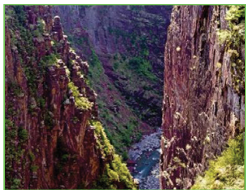
Pélites rouges des gorges de Daluis

« L'ESCARGOT EST UN GASTÉROPODE QUE L'ON TROUVE DANS NOS CAMPAGNES 3 ». LES ESCARGOTS DU MERCANTOUR JOUENT ENCORE LES ORIGINAUX : PAS QUESTION DE SE RETROUVER DANS TOUS LES JARDINS, À L'OMBRE DE TOUTES LES SALADES.