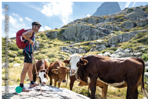
Rencontre avec un berger