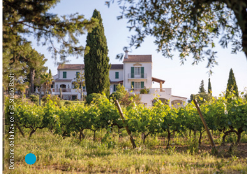
Domaine de la Navicelle