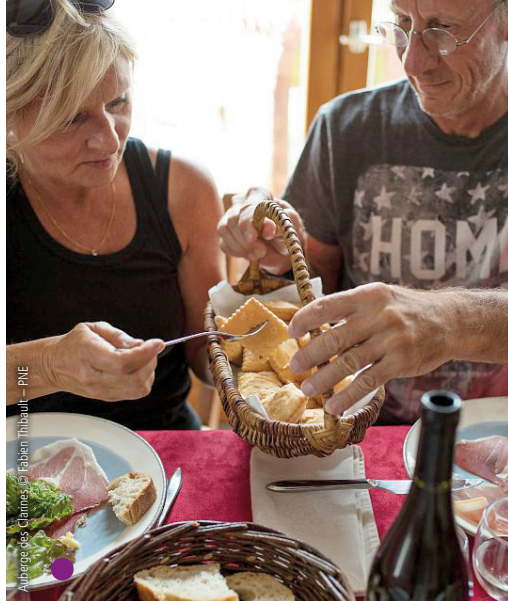
Auberge des Clarines