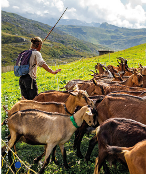
Chèvres en vallée de l'Arantaise