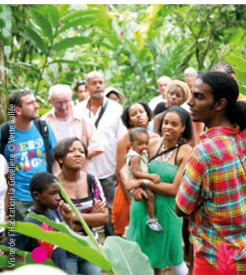
Visite de l'habitation la Grivelière