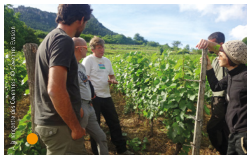
A la rencontre des Cévennes