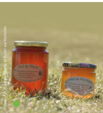
Miel de Thyon et Miel de Montagne © Le Rucher aux Marmottes

✉ vanvoyages@compagnie-guides-vanoise.com