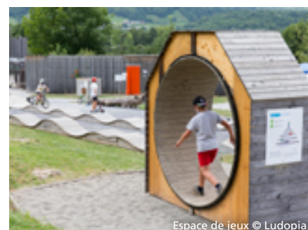
Espace de jeux

Elles privilégient des comportements respectueux de la nature ainsi que des modes de déplacement « doux » comme le covoiturage.