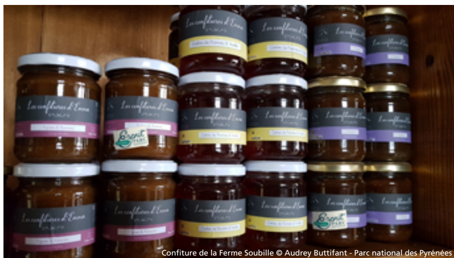
Confiture de la Ferme Soubille

Des produits locaux pour contribuer à la vie du territoire