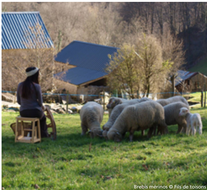
Brebis mérinos