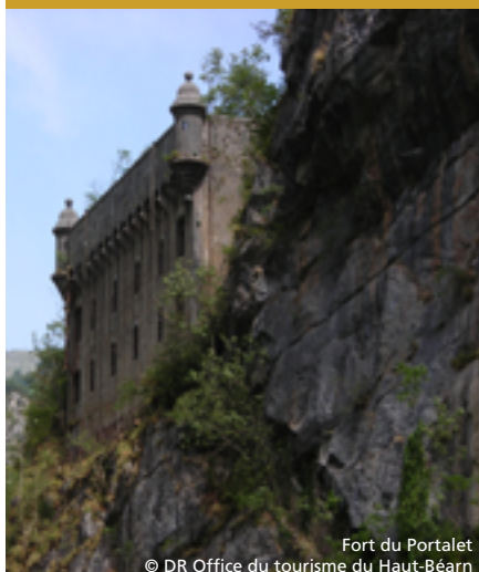
Fort du Portalet