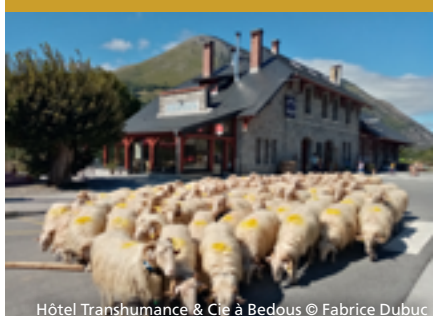
Hôtel Transhumance & Cie à Bedous

Édith MOUTENGOU et Fabrice DUBUC, hôtel restaurant « Transhumance & Cie » à Bedous (vallée d'Aspe)