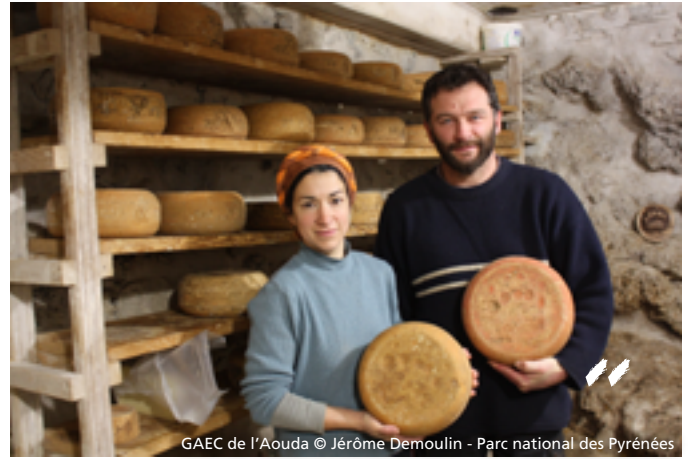
GAEC de l'Aouda

Les producteurs laitiers sont particulièrement attachés au territoire préservé qui les entoure et dans lequel ils travaillent en harmonie.