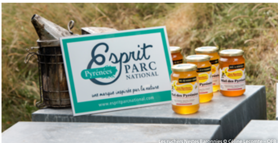
Les ruchers Nests Baronnie

Les miels peuvent être réalisés à partir de « toutes fleurs de montagne », bruyère, châtaignier, rhododendron, tilleul, etc.