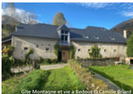
Gîte Montagne et vie à Bedous

Ils vous proposent une offre inspirée par la nature pour poser, le temps d'un séjour ou d'une sortie, un autre regard sur le Parc national ou pour découvrir des produits agricoles ou artisanaux issus de pratiques respectant la biodiversité.